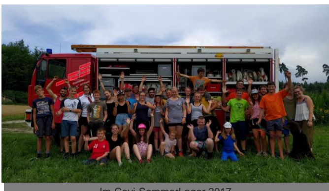
Im Cevi-SommerLager 2017

Wir freuen uns auf Dich! Das Cevi-Leiterteam